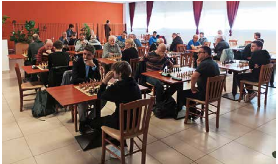
V Žireh je sredi maja potekal prvi letošnji šahovski turnir za pokal Poljanske doline.

Po triletnem zatišju zaradi covida-19 se vračajo turnirji serije PPD. Letos so predvideni štiri turnirji, prvi je bil odigran v Žireh drugo majsko soboto. Zbralo se je 33 šahistov, med njimi tudi ena šahistka.