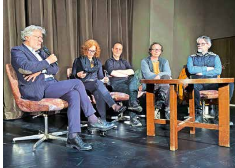
Sredi aprila so v kinodvorani v Žireh gostili film Tržaške prikazni in njegove ustvarjalce.