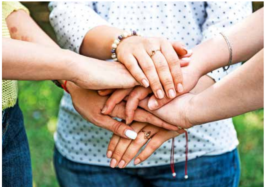
V žirovski knjižnici se vsako tretjo sredo v mesecu srečuje skupina svojcev.

Domača oskrba je zelo plemenito in hkrati tudi zelo zahtevno delo, mnogi se pred to nalogo znajdejo nepripravljeni, brez znanja in ne vedo, kam se obrniti po pomoč. Glavni namen skupine je, da si člani nudimo oporo in pomoč. Na srečanjih si člani skupine izmenjujemo izkušnje pri oskrbi in koristne informacije. Pogovarjamo se o različnih boleznih svojih svojcev, s kakšnimi težavami se srečujemo in kako jih rešujemo. Nekateri člani imajo že veliko izkušenj pri skrbi za onemogle in lahko s svojim znanjem pomagajo tistim, ki se s tem še srečujejo. Oskrbovanje je z znanjem in podporo lažje. Na majskem srečanju smo govorili o