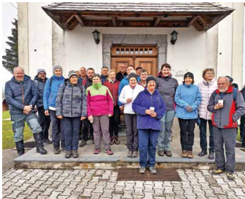
Romarji iz Žirov na Vrhju Svetih Treh Kraljev

Cerkev na Vrhju je bila v sedanji obliki postavljena na mestu starejše leta 1698. Kot božja pot k Svetim Trem Kraljem je še posebno slovela 17. in 18. po celi deželi Kranjski in širše. Tu so se nekoč priporočali tudi Mariji Pomočnici, predvsem za zdravje ljudi in živine. Obiskovalce pritegne razkošna cerkvena oprema, saj so v njej trije baročni oltarji iz črnega kamna. Na glavnem je grb škofije Freising, ki priča, da je vse do tu segalo loško freisinško gospodstvo. Sveti trije kralji,