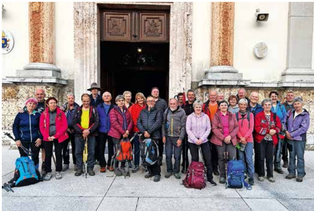
Romarji društva ŠmaR iz Žirov pred baziliko Marije Pomagaj na Brezjah

Nekaj dežnih kapljic kot za »žegen iz nebes« nas je porosilo kmalu po začetku, nato pa smo lahko dežnike in pelerine za ta dan kar pospravili na dno naših nahrbtnikov. Do Hotavelj je pot minila zelo hitro, tam pa nas je čakala naslednja skupina romarjev. Število romarjev se je povzpelo kar nad 20, vsak s svojimi mislimi smo pot premagovali bolj ali manj zadihani. Vmes je ura odbila sedem in čas za prvo povezavo z Bogom v molitvi. Pod Starim vrhom sta se nam pridružili tudi naši dobri romarski znanki iz Poljan in skupina se je spet povečala. V Selško dolino smo prispeli kmalu po opoldanskem angelovem češčenju, ki smo ga zmolili pred kapelico med potjo. Da, teh znamenj na naši poti ne manjka, in prav lepo je gledati, kako so nekatera lepo okrašena v Marijinem šmarničnem mesecu maju. Malce počitka v Selcih je bilo dobro tako za