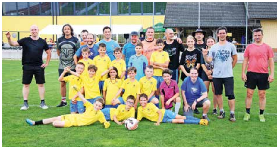
Ob praznovanju petdesetletnice so se na tekmah s starši in trenerji najprej predstavile mlajše selekcije.