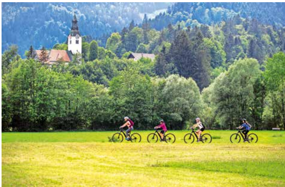
Konec tedna bo potekal Žirovski kolesarski krog. Fotografija je simbolična.