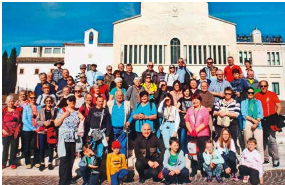
Žirovski romarji pri svetišču stare cerkve in samostana San Giovanni Rotondo.

Po obilnem zajtrku in še rahlo utrujeni od vožnje prejšnjega dne se odpeljemo v lepem sončnem dopoldnevu do svetišča stare cerkve in samostana San Giovanni Rotondo, kjer je živel in deloval Francesco Forgione. Ob posvečenju v duhovnika si je izbral ime pater Pij. Najprej imamo mašo v stari cerkvi. Poleg nje pa stoji ogromna nova cerkev, ki sprejme v prostor 6500 ljudi. V povprečju jo obišče vsako leto šest do osem milijonov romarjev. Posvečena je bila leta 2004,