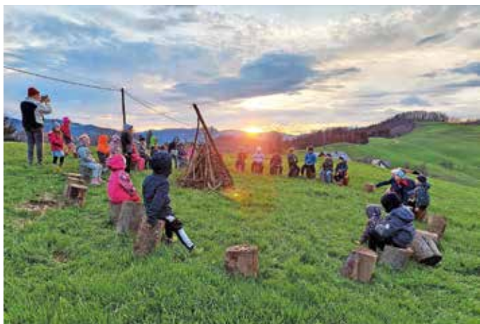
Na letovanju v Vinharjah so predšolski otroci uživali ob tabornem ognju.