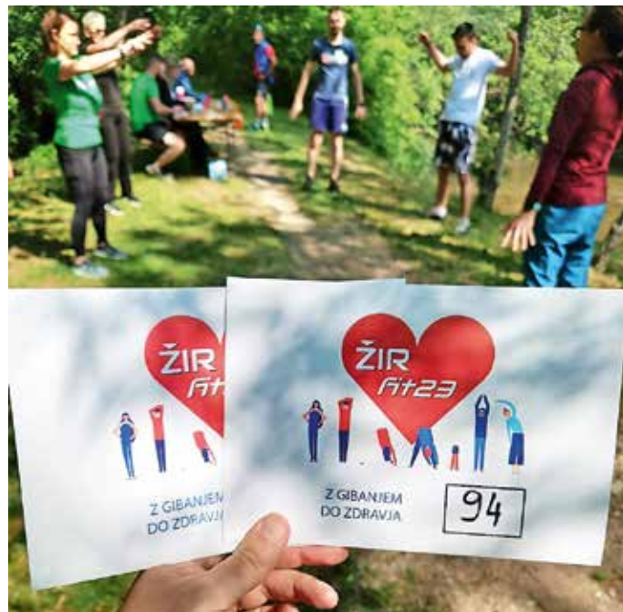
Žirfit 2023 je razgibal skoraj sto Žirovcev.

Lepa udeležba in dobro vzdušje, ki sta zaznamovala sončno sobotno dopoldne na ŽIRfitu, sta znova dokazala, da se Žirovci dobro zavedajo pomena dejavnega življenjskega sloga in odgovornosti za svoje zdravje in dobro počutje. Kaj pa pravijo rezultati? »Na splošno so se udeleženci v vseh starostnih kategorijah najbolje odrezali pri t. i. tappingu – testu dotikanja plošče z roko, ki ocenjuje hitrost izmeničnih gibov rok. Povprečne rezultate so dosegali na področjih gibljivosti ramenskega obroča, ravnotežja ter moči mišic nog, rok in ramenskega obroča. Podpovprečni so bili rezultati pri meritvah predklona, moči stiska pesti in poligona nazaj, nekoliko slabši kot navadno pa so bili tudi rezultati na testih vzdržljivosti, torej pri hoji na dva kilometra in hoji oziroma teku na 600-metrski razdalji. Ne glede na rezultate smo bili veseli množične udeležbe tudi na zahtevnejših testih vese v zgibi,