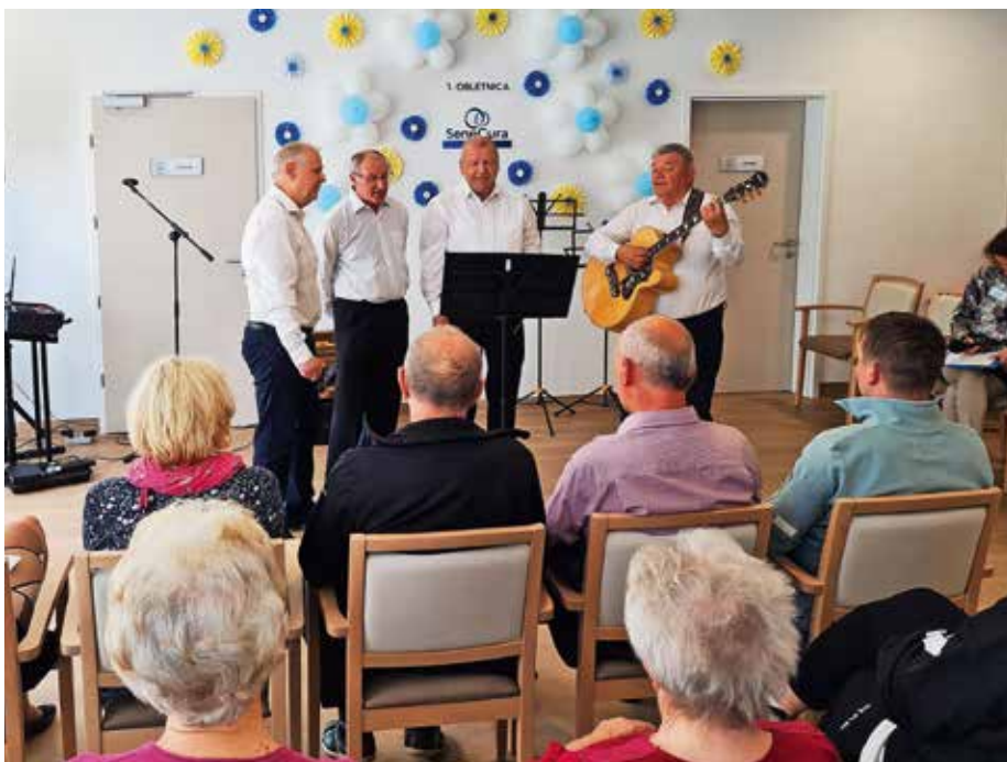
Praznovanje prve obletnice v SeneCura domu starejših občanov Žiri

Vsi skupaj se dnevno trudimo, da je življenje v njem prijazno, prijetno in pestro. To dokazujemo s številnimi kulturnimi in družabnimi aktivnostmi,