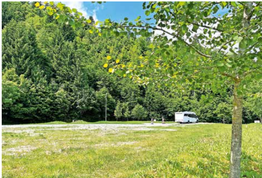
V Športno-rekreacijskem centru Pustotnik so uredili štiri postajališča za avtodome.

Pri projektu (NAD) gradimo ponudbo Škofjeloškega se je sicer pod okriljem Razvojne agencije Sora (RAS) povezalo pet partnerjev – Lokalna akcijska skupina loškega pogorja in vse štiri občine na Škofjeloškem. Skozi štiri manjše naložbe so nadgradili ponudbo na škofjeloškem območju tako za lokalne prebivalce kot turiste, je pojasnil direktor RAS Gašper Kleč. V Žireh so v sklopu projekta konec aprila končali urejanje