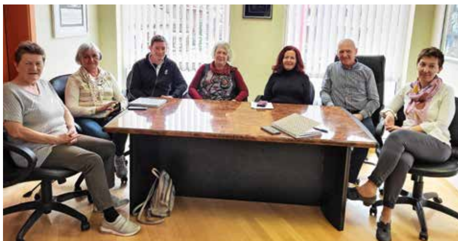
Voditeljice žirovskih skupin marca na obisku pri županu

Drugo skupino, Podmladek, je osnovala Vilma Mazzini: »V letu 2019 sem naredila seminar za vodjo skupine Starejši za starejše. V začetku septembra istega leta smo se prvič zbrale in ustanovile sku-