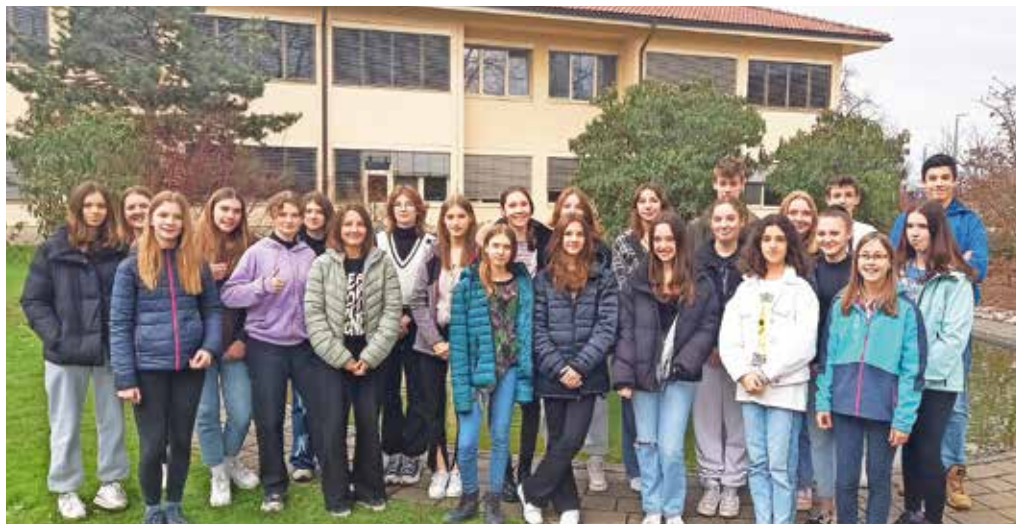
Mladi raziskovalci na regijskem tekmovanju v Naklem