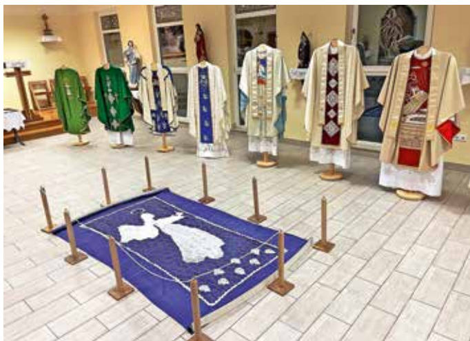
V kapeli Male Cvetke so na razstavi Čipke so bile njeno življenje občudovanje vzbujali predvsem mašni plašči.