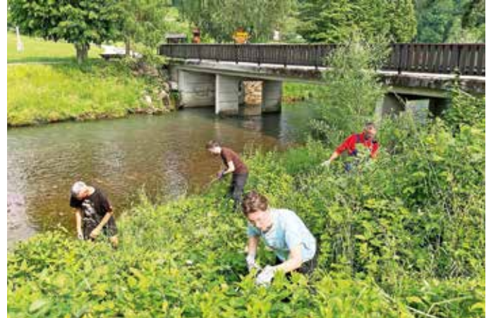
Delovni akciji odstranjevanja invazivnih tujerodnih rastlinskih vrst so se pridružili tudi prostovoljci v Žireh.